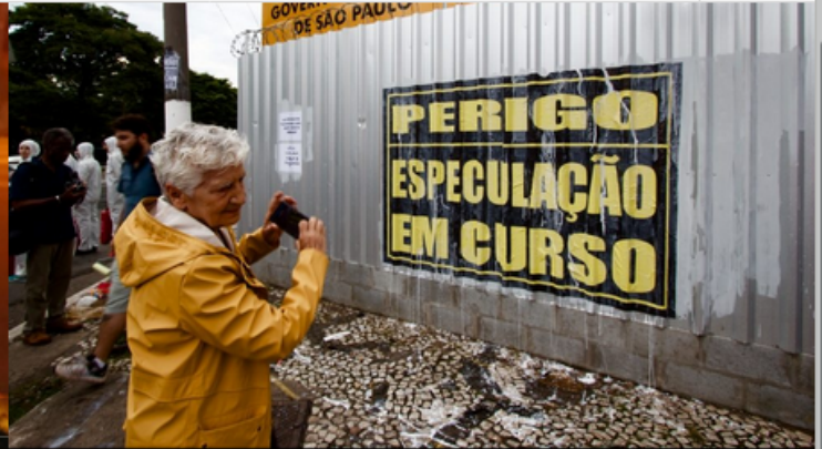
September 10, 2019