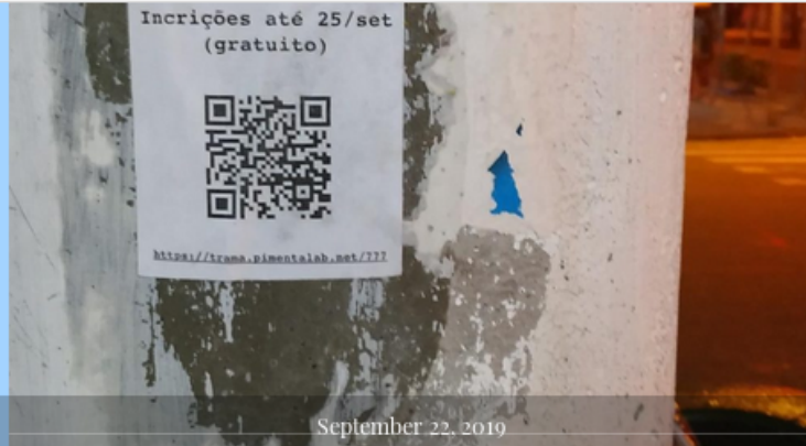
September 22, 2019

QUESTÕES VINCULANTES: AFETOS E PROBLEMAS DO COMUM